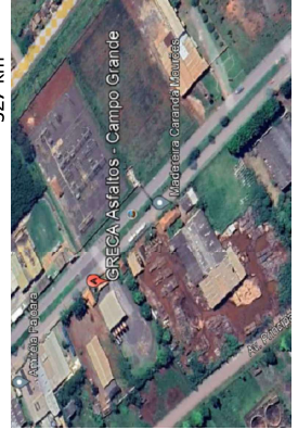
Campo Grande CBUQ e Emulsão Asfáltica 327 km